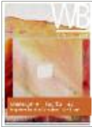
Weitergehen – Tag für Tag – Werkblatt 4/2020

Neuaufgabe des erfolgreichen Werkblatts!