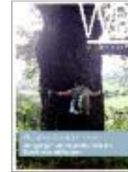
Glauben im Alter leben – Werkblatt 3/2020