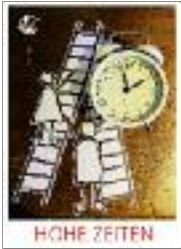
Hohe Zeiten – Geschenkheft 2020