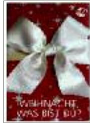
Weihnacht, was bist du? – Geschenkheft 2020