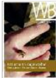
Mit anderen Augen sehen – Werkblatt 5/2020

Neuaufgabe des erfolgreichen Werkblatts!