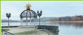
Leben ist das Einatmen der Zukunft. (Pierre Leroux)

Die aussagekräftigen Texte und Bilder in diesem Geschenkheft sind im Rahmen des Projektes ÜberLebensMittel WASSER des Internationalen Hilfswerks MISEREOR, der Katholischen Bundesarbeitsgemeinschaft für Erwachsenenbildung (KEB) und der Stiftung Zukunft der Arbeit und der sozialen Sicherung (ZASS) entstanden. Die ‚Wasserbotschafter/innen‘ setzen sich in Wort und Bild mit der auch von Papst Franziskus in seiner Enzyklika „Laudato si“ aufgegriffenen, globalen „Wasserfrage“ auseinander. Sie wollen zu einem anderen, bewussteren Umgang mit der elementaren Ressource Wasser anregen.