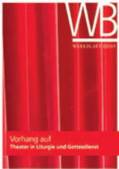
Vorhang auf – Werkblatt WB 3/2019

Das Theater bietet eine wundervolle Chance, Altbekanntes in neue Worte zu fassen, Geschichten nicht nur vor dem geistigen Auge, sondern ganz real lebendig werden zu lassen und Abwechslung ins Leben zu bringen. Gerade in unserer Zeit, in der jeder schon alles kennt, alles und jegliches im Internet zu finden ist, sich unsere Gesellschaft deutlich schneller wandelt als unsere Liturgie und Kirche, ermöglicht das Theater eine ganz neue Ausdrucksform für alte Geschichten, biblische Szenen und aktuelle Entwicklungen in Kirche, Staat und Gesellschaft. Probieren Sie es doch einfach mal aus!