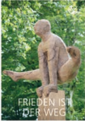
Frieden ist der Weg – ein Geschenkheft WB 1/2019