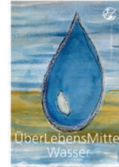
ÜberLebensMittel Wasser – ein Geschenkheft WB 2/2019