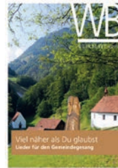
„Viel näher als Du glaubst“ – Lieder für den Gemeindegesang WB 4/2019

Das Theater bietet eine wundervolle Chance, Altbekanntes in neue Worte zu fassen, Geschichten nicht nur vor dem geistigen Auge, sondern ganz real lebendig werden zu lassen und Abwechslung ins Leben zu bringen. Gerade in unserer Zeit, in der jeder schon alles kennt, alles und jegliches im Internet zu finden ist, sich unsere Gesellschaft deutlich schneller wandelt als unsere Liturgie und Kirche, ermöglicht das Theater eine ganz neue Ausdrucksform für alte Geschichten, biblische Szenen und aktuelle Entwicklungen in Kirche, Staat und Gesellschaft. Probieren Sie es doch einfach mal aus!